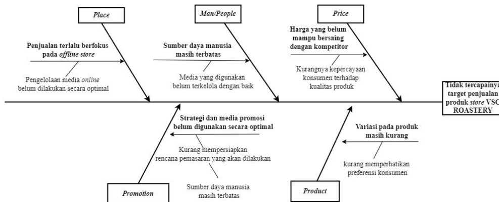
Gambar 2. Fishbone Diagram